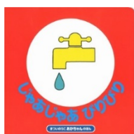
じゃあじゃあ びりびり まつい のりこ/作・絵 偕成社