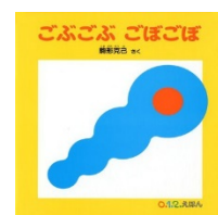
ごぶごぶ ごぼごぼ 駒形 克己/さく 福音館書店