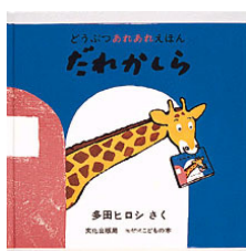
だれかしら 多田 ヒロシ/さく 文化出版局

平成 26 年度は 7 種類準備しました。当日は、6 種類から 2 冊お届けしています。