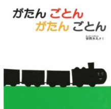
がたんごとん がたんごとん 安西 水丸/さく 福音館書店