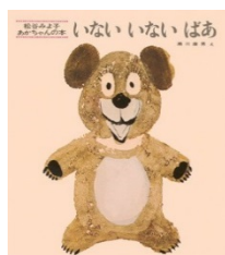
いない いない ばあ 松谷みよこ/文 瀬川康男/え 童心社