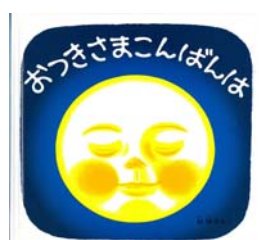
おつきさま こんばんは 林 明子/さく 福音館書店