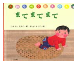
まてまてまて こばやし えみこ/案 ましま せつこ/絵 こぐま社