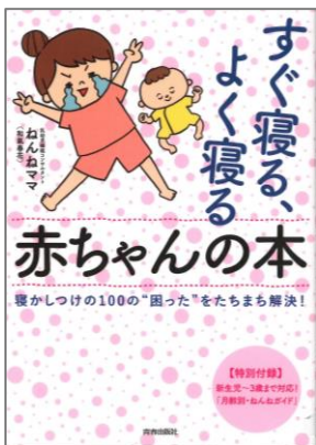
「すぐ寝る、よく寝る赤ちゃんの本」 ～寝かしつけの100の“困った”をたちまち解決！ ねんねママ/著 青春出版社

“赤ちゃんが寝ない！”と悩んでいるパパ・ママに役立つ一冊です。 赤ちゃんも一人一人違います。自分の赤ちゃんに合った寝かせ方が 見つかるといいですね。