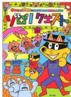
『ソロリクエスト』 原 はら ゆたか/原 げん 作 さく ポプラ しや 社