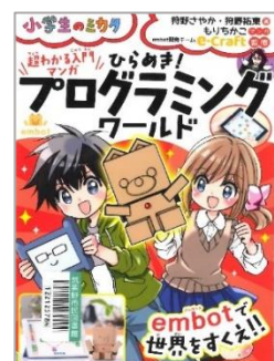
『ひらめき！プログラミングワールド』 狩 かの 野 の さやか/著 ちやう しょうがく しょうがく かん 小学 しょうがく 館