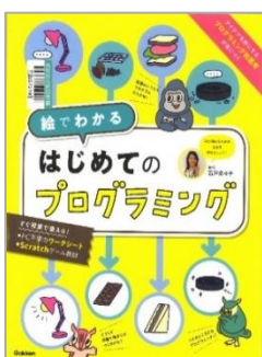
『絵 え でわかるはじめてのプログラミング』 いしど 奈 な なこ/監 かん 修 しゆ 学 がく 研 けん プラス